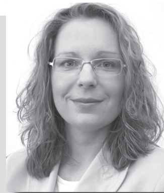
Prof. Dr. Claudia Kemfert Leiterin der Abteilung Energie, Verkehr, Umwelt am DIW Berlin

Insbesondere muss es einen EU-Strommarkt geben. Das heißt, auch ein besserer Handel zwischen den europäischen Ländern ist notwendig. Dazu muss man das Netz ausbauen, insbesondere zwischen den europäischen Ländern müssen sogenannte Grenzkuppelstellen verstärkt ausgebaut werden, weitere Netze müssen entstehen. Dann brauchen wir eine EU-Regulierungsbehörde, die darüber wacht, dass es keinen Marktmissbrauch gibt und dass vor allen Dingen gleiche Spielregeln in allen Ländern gelten. Einzelne Länder dürfen sich nicht abschotten, ihre nationalen Champions kreieren, die dann einen Vorteil haben auf dem europäischen Strommarkt.